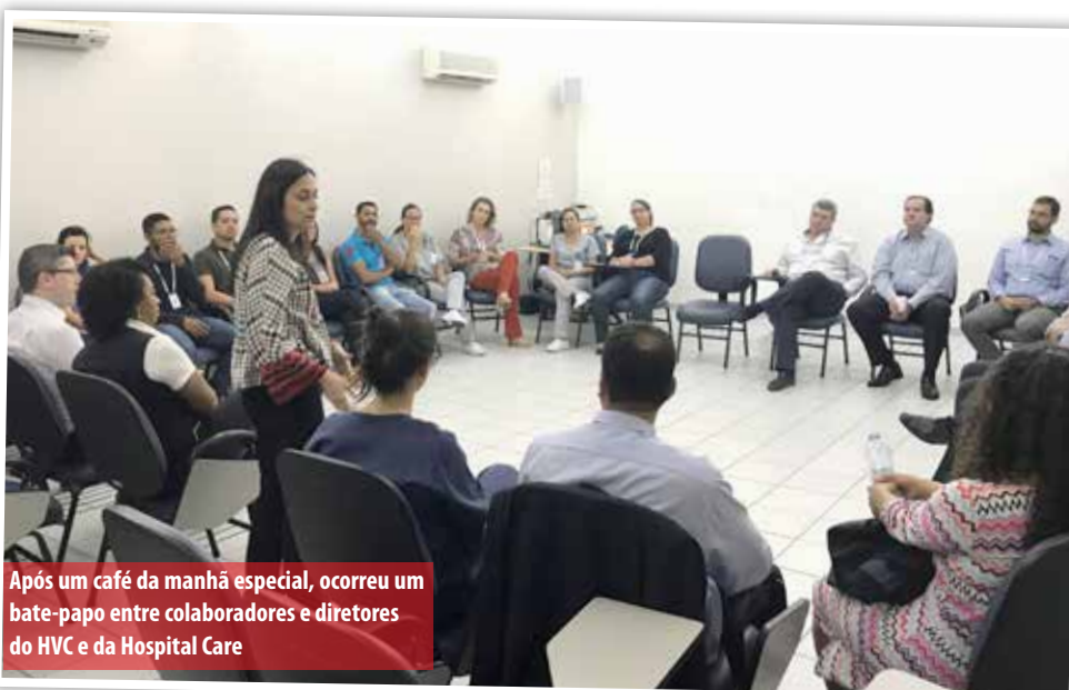
Após um café da manhã especial, ocorreu um bate-papo entre colaboradores e diretores do HVC e da Hospital Care

A publicação também está recheada de novidades. Uma delas é a realização