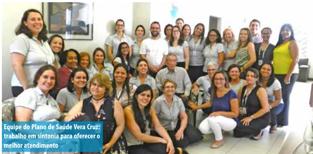
Equipe do Plano de Saúde Vera Cruz: trabalho em sintonia para oferecer o melhor atendimento

As equipes trabalham totalmente integradas visando garantir aos 31 mil associados sempre o melhor atendimento apoiado em princípios de conhecimento, experiência, profissionalismo e prazer em servir.