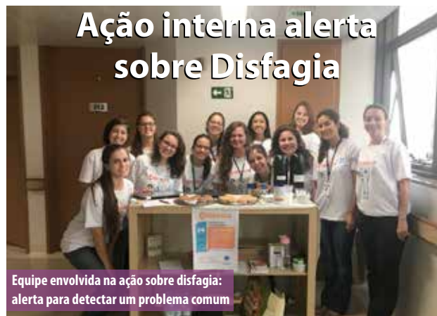
Equipe envolvida na ação sobre disfagia: alerta para detectar um problema comum

Para chamar a atenção sobre um problema comum que pode atingir pessoas de todas as idades, o Hospital Vera Cruz promoveu no dia 20 de março uma ação especial de conscientização sobre a disfagia, caracterizada por qualquer dificuldade durante a alimentação.