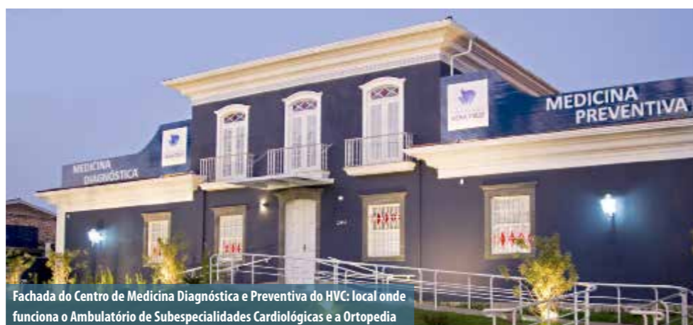
Fachada do Centro de Medicina Diagnóstica e Preventiva do HVC: local onde funciona o Ambulatório de Subespecialidades Cardiológicas e a Ortopedia

Outra novidade é o Ambulatório de Subespecialidades Cardiológicas, localizado no Centro de Medicina Diagnóstica e Preventiva, na Nova Campinas. Ali, cardiologistas especializados em Cirurgia Cardíaca, Hemodinâmica, Insuficiência Cardíaca, Arritmologia e Cardiopatia Congênita atendem regularmente pacientes que agendam seus horários pela central de marcação de consultas ou por meio de encaminhamentos médicos. Para casos de urgência, as consultas acontecem em até 24 horas e para procedimentos eletivos, o