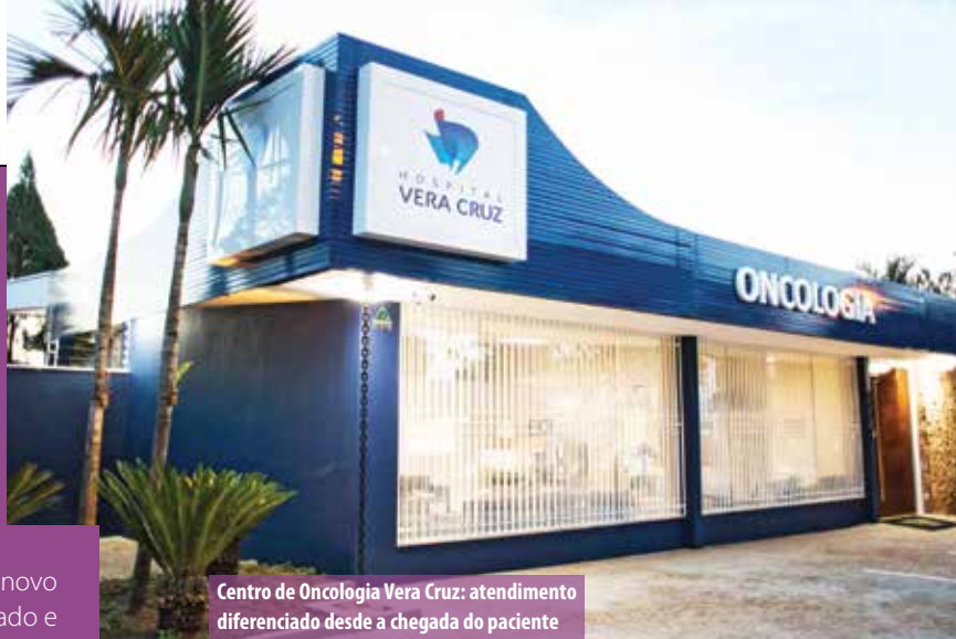
Centro de Oncologia Vera Cruz: atendimento diferenciado desde a chegada do paciente