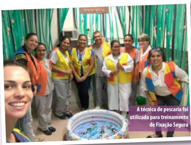
A técnica de pesca foi utilizada para treinamento de Fixação Segura