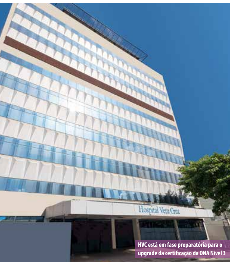
HVC está em fase preparatória para o upgrade da certificação da ONA Nível 3

Outra novidade é o Projeto Diagnóstico Rápido, que acelera a realização de exames necessários, oferecendo ao paciente a comodidade de sair da consulta com todos os encaminhamentos e agendamentos realizados, inclusive de cirurgia, se for necessária.