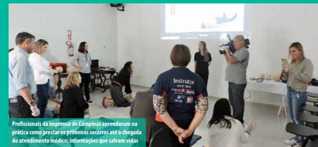
Profissionais da imprensa de Campinas aprenderam na prática como prestar os primeiros socorros até a chegada do atendimento médico: informações que salvam vidas

Em seguida, segundo ela, é a vez de solicitar um desfibrilador e enquanto aguarda a ajuda chegar, devem ser iniciadas imediatamente as compressões cardíacas no