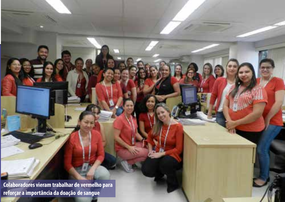
Colaboradores vieram trabalhar de vermelho para reforçar a importância da doação de sangue

Colaboradores do CAD, Auditoria, Faturamento, Central de Autorizações, Recurso de Glosa e Regras de Negócios se organizaram para uma ação que visou a conscientização sobre a importância da doação de sangue. Além de uma conversa sobre o tema, todos vieram trabalhar no dia 29 de junho com uma roupa vermelha para lembrar a relevância do Movimento Junho Vermelho.