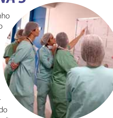
Durante a visita, os profissionais mostraram engajamento e envolvimento com o processo de avaliação

A equipe da Qualidade está preparando as devolutivas e relatórios da visita e os novos ciclos de auditorias internas acontecem em agosto e setembro.