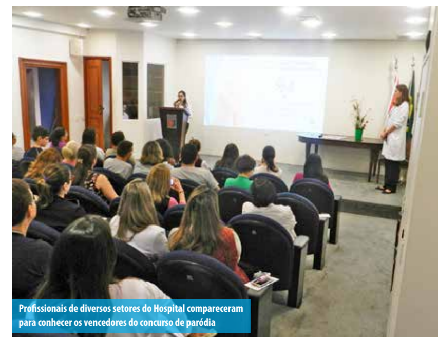
Profissionais de diversos setores do Hospital compareceram para conhecer os vencedores do concurso de paródia

Além de atingir o objetivo internamente, o conjunto de ações da campanha garantiu ao Vera Cruz o segundo lugar no concurso “Está em suas Mãos a Prevenção de Sepse em Serviços de Saúde”, promovido pela Secretaria de Estado da Saúde de São Paulo.