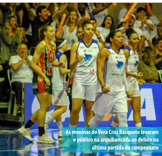
As meninas do Vera Cruz Basquete levaram o público na arquibancada ao delírio na última partida do campeonato